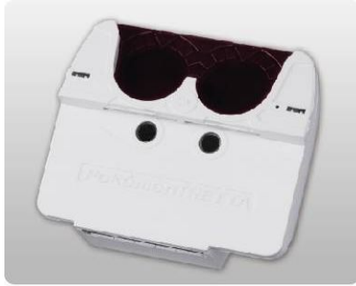
●トレッタスキャナー・1個