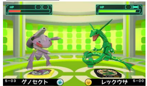
ゲーム画面 ※画面は開発中のものです。