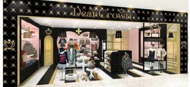
ヴィーナスフォート店イメージ