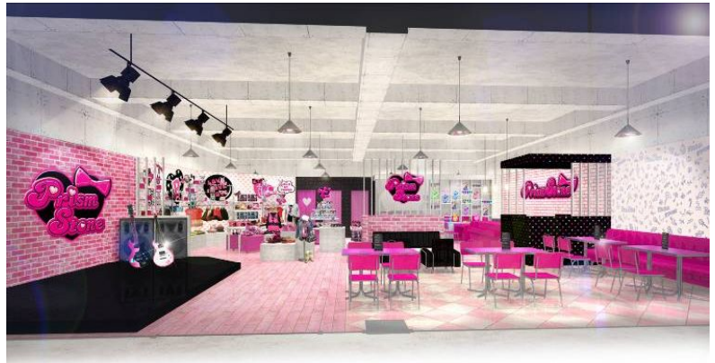
ショップイメージ

「ライブフィット」の集大成ともいえるショップ展開に関しては、今回のストーリーの舞台でもある原宿エリアに新ショップをオープンすることが決定しました。こちらは主人公たちが経営するインディーズショップとしてアニメの中にも登場するほか、現実では買い物やゲームが楽しめるほか、実写コーナーの撮影にも使われる予定です。『プリティーリズム』ファンの聖地として、ものを売るだけでなく体験できる店舗へ、“売り場のステージ化”を目指してまいります。