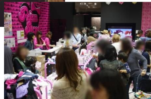
お台場ヴィーナスフォート店 店内