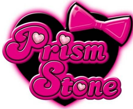
「プリズムストーン」