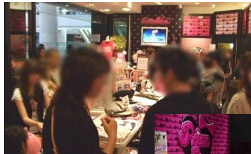
横浜ランドマーク店 店内

開催箇所 35店舗 (2012年4月~2013年1月) 売上実績 4,500万円 (2012年4月~2013年1月10日付) 事業部全体 売上見込 6億円