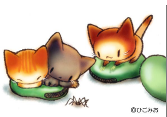
「まめまめねこねこ」