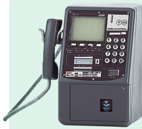
DMC-7 (デジタル公衆電話機) 1996年(平成8年)

1982年に登場したテレホンカードを使って通話できる公衆電話機の小型軽量版。今も設置台数が多く最も認知度の高い公衆電話機。