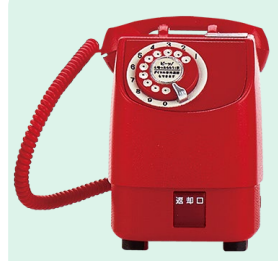
新形赤電話機 1971年(昭和46年)

一目で公衆電話とわかるグリーンのカラーリングで、大きく見やすいボタンや凹凸で分かりやすい投入口など、ユニバーサルデザインを採用した。