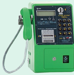
MC-D8 (デジタル公衆電話機) 2016年(平成28年)

大型ディスプレイを装備し、操作ガイダンスや通話先の電話番号、音量レベルなどを表示。