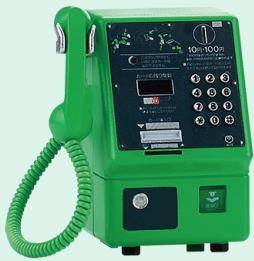
MC-3P (アナログ公衆電話機) 1986年(昭和61年)

1982年に登場したテレホンカードを使って通話できる公衆電話機の小型軽量版。今も設置台数が多く最も認知度の高い公衆電話機。