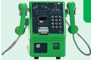
デュエットホン 1996年(平成8年)

2つの受話器を備えた通称“デュエットホン”。3人同時に通話ができる珍しい公衆電話。1990年の電話開業100年記念に製作された。