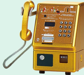
金色の公衆電話機 1993年(平成5年)

2つの受話器を備えた通称“デュエットホン”。3人同時に通話ができる珍しい公衆電話。1990年の電話開業100年記念に製作された。