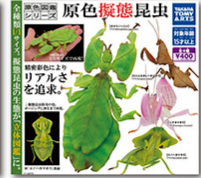
ガチャの造形・塗装の技術 は日々進化!擬態する昆虫 をリアルに再現