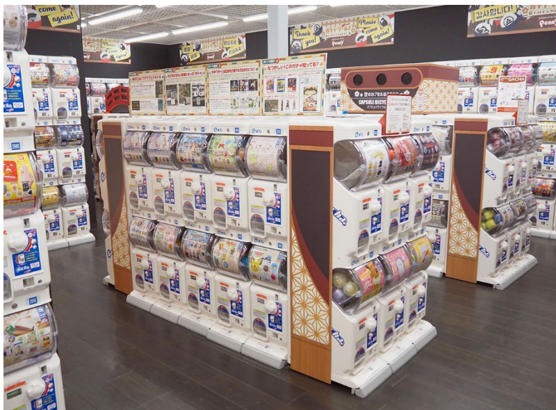
ガチャの日ヒストリーパネルの展示例 (成田国際空港 第1ターミナル地下1階「ガチャワールド」)