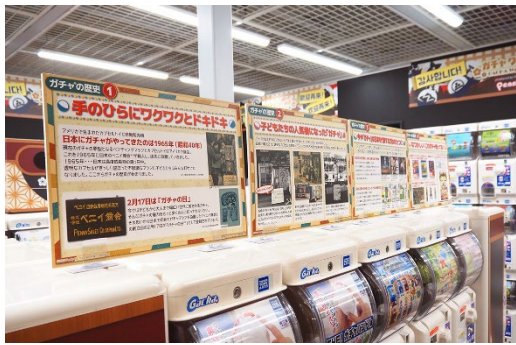
写真：成田国際空港 第1ターミナル地下1階「ガチャワールド」