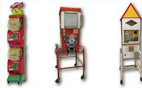
おやつキング ビッグマシン キンパンディングマシン