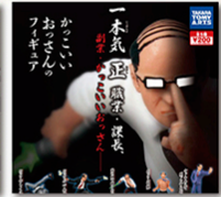
思わず2度見するインパクト ついつい買ってしまう不思議 な魅力もガチャならではの