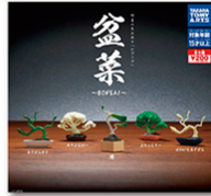
盆栽ならめ盆“菜” 鉢植えの野菜たちが生み 出す「わびさび」

古くから日本に伝わる伝統芸能や文化を ガチャで表現することで日本国内外問わず多くの方に 日本文化を知ってもらおうきっかけになります。 もちろんガチャならではのちょっと肩の力を抜いたゆる い感じの商品もあります。