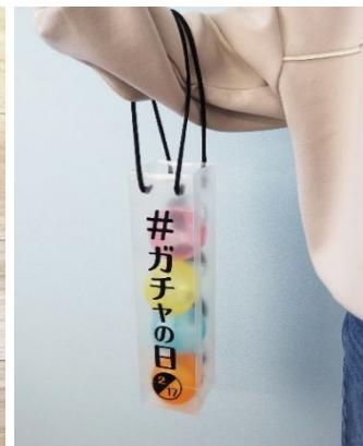
※カプセルは配布物には含まれません