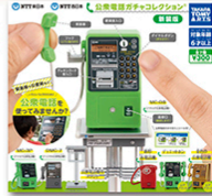
リアルな再現性はもちろん 使い方を学べると話題に 東日本電信電話株式会社 西日本電信電話株式会社 協力:NTT研究所

小さな鉢に自然を再現した「盆栽」 ひな人形やその家具、調品など細密な技術をほど こした繊細な工芸品を見ても日本では小さな物を精 巧に作る技術が磨かれ、ミニチュア化文化が昔から発 展しているのです。