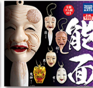
日本の伝統芸能「能楽」 古くからある歴史分野を 知るきっかけにも