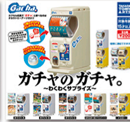
ミニチュアサイズながら 本物とそっくりのギミック を搭載しリアルさを追求