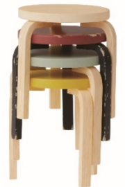
▲スタッキングできます