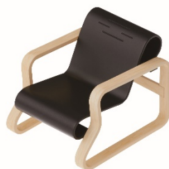
41 アームチェア パイミオ