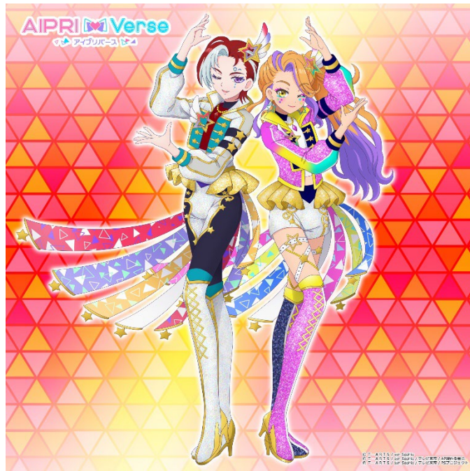
『ワッチャプリマジ！』「まつり、あうる、ひな、あまね」描き下ろしビジュアル

タカラトミーアーツは、『ひみつのアイプリ』のテレビアニメ放送に合わせて、キャラクターカードを集めてアニメ連動のライブ体験を楽しめる『ひみつのアイプリ』と、アニメと同じ世界観で自分のアバターとなる「マイキャラ」を育成しておしゃれと交流を楽しめる『アイプリバース』の2つのアミューズメントゲームを同時に展開しております。『アイプリバース』は、自分だけの「マイキャラ」で「アイプリデビュー」ができる、「プリティーシリーズ」の“楽しい”が詰まったアミューズメントゲームです。「コーデ」を集めておしゃれをして、ゲーム内の「アイプリひろば」で、アニメキャラクターや他のユーザーの「マイキャラ」と出会い、様々な遊びが一緒に楽しめます。