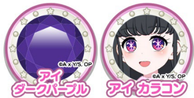
▶【おしの子】アイコーデ

【推しの子】に登場する「B小町」の絶対的エース「アイ」とお揃いのコーデ【おしの子】アイコーデを着たキャラクターが「アイプリひろば」にランダムに登場し、一緒に遊ぶとコーデを入手するチャンスがあります。また、「5だん」期間中に遊ぶと「アイ」とお揃いのヘアカラーとアイカラーを「マイキャラパーツ」としてもらうことができます。