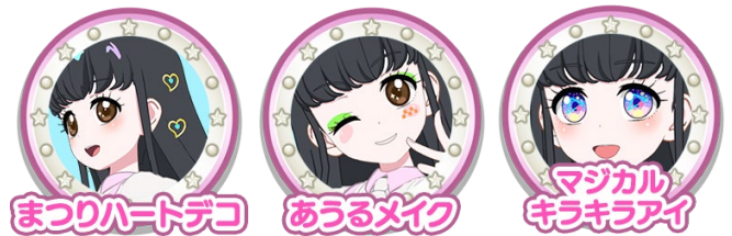
▼『ワッチャプリマジ！』のゲーム楽曲