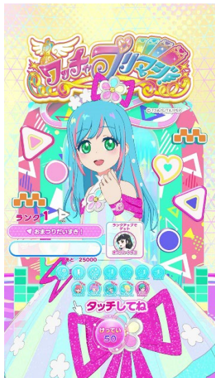
▲ドリーム 「きせきのプリマジスタ」