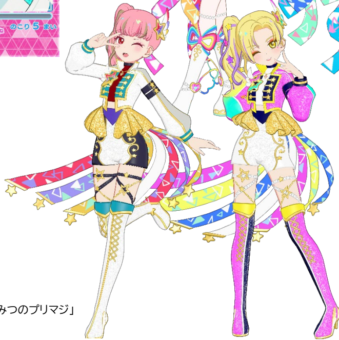
▶新作コード「ひみつのプリマジ」

「マイキャラ」のドリーム(夢)を選択し成長させることができる育成システム「ドリームシステム」には、特別なドリームとして「きせきのプリマジスタ」が登場し、「あうるメイク」など『ワッチャプリマジ！』にちなんだ「マイキャラパーツ」を手に入れることができます。さらに、当時のアミューズメントゲームで使用されていた楽曲が4曲搭載され、ミニライブで遊ぶことが可能です。